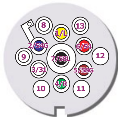
Multicom 7+6 broches